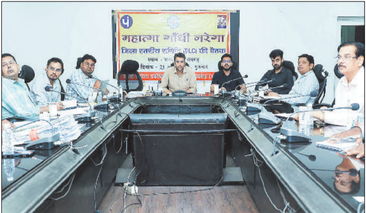
बैठक लेते कलेक्टर।

30 मई तक सभी लंबित कार्य पूर्ण करने के निर्देश, नरेगा सॉफ्ट पर डेटा शुद्धिकरण पर विशेष